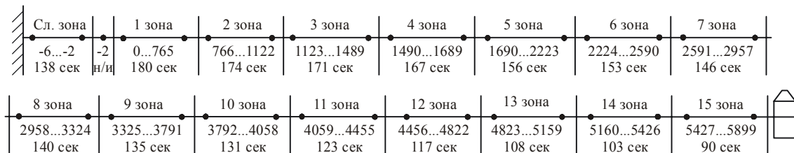
Рис.5.1.2. Структура дискового пространства SR.

Зонное распределение для семейства SR показано на Рис. 5.1.2.